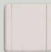
P 10 amande (A)