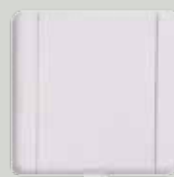
P 10 blanche (B)