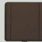
P 10 chocolat (CH)