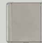
P 10 gris métallisé (GM)