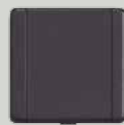
P 10 anthracite (AN)