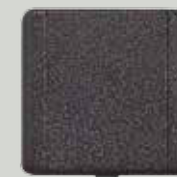
P 10 martelé anthracite (MA)