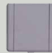
P 10 gris (G)