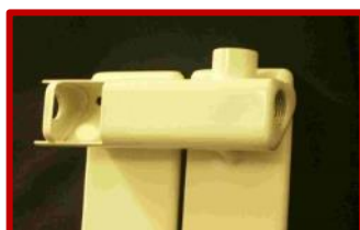
Collecteurs à forme triangulaire.

La gamme Chorus, aux tubes plats et aux collecteurs triangulaires, permet d'équilibrer convection et rayonnement pour diffuser une chaleur douce et homogène.